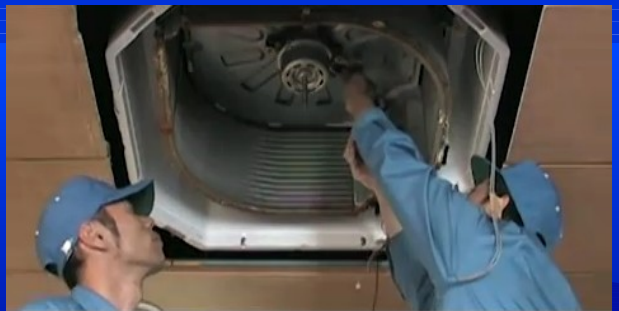
モーターの配線を外す