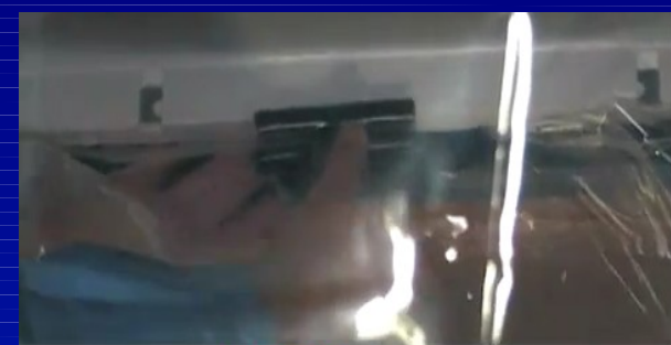
クリップ ST-210 を用いて 隙間なく取り付ける