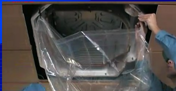
洗浄シート SA-P01D を仮止めし