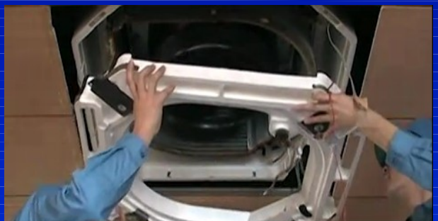
ドレンパンの中はスライム・カビな どが繁殖するため、特に洗浄が必要