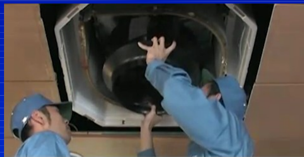
ターボファンを取り外し、洗浄する