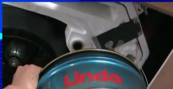
特に夏場は結露した水が溜まってい ることが多い