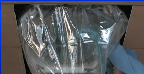
希釈倍率は汚れに応じて調整する