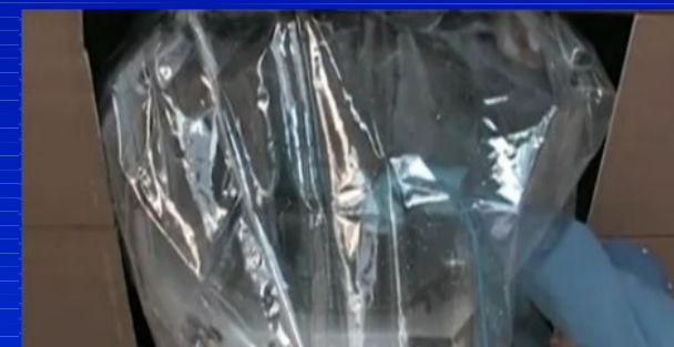
アルミフィンの洗浄は 当社指定特殊洗剤 を使用する