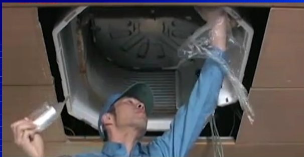
配線をまとめて、養生する