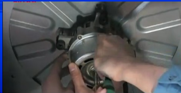
モーター本体を取り外す