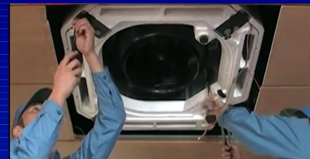
ドレンパンを取り外し、洗浄する