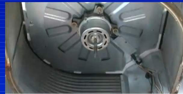
ターボファンを取り外し、洗浄する