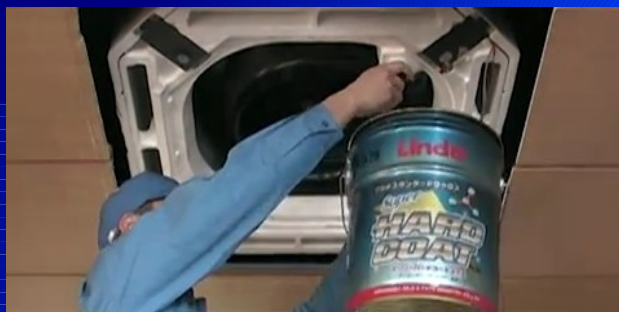
ドレンパンの中に残っている汚水を 抜く