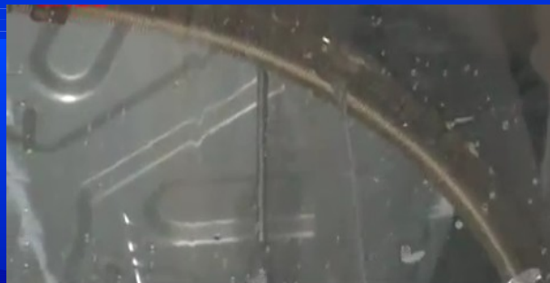
【洗浄のコツ】 アルミフィンに対してゆっくりと垂直 方向に噴霧する