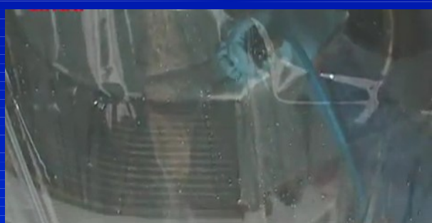
使用ポンプはACジェット リール付