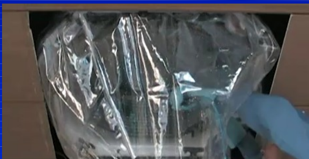
保護メガネ・手袋・帽子などを着用し、アルミフィンの洗浄及びリンス作業を行う